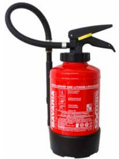
L'extincteur Lithium-X pour éteindre les feux de batteries au lithium-ion !