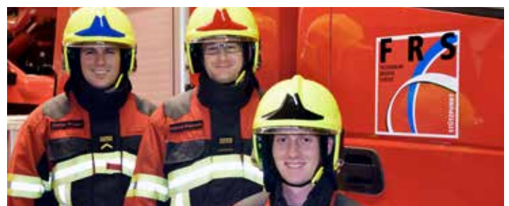
Sapeurs-pompiers de la région de Sursee – équipés du nouveau casque MSA Gallet F1 XF