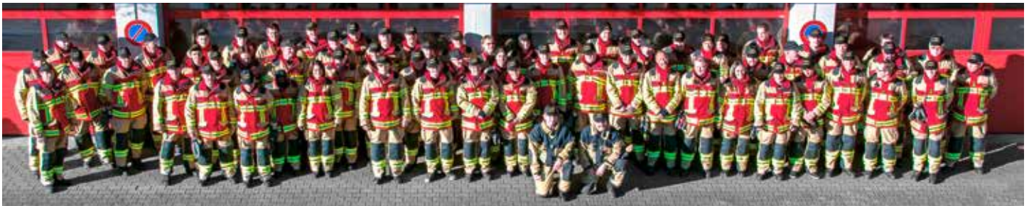
Sapeurs-pompiers de Grosshöchstetten – équipés de vêtements HUNTER TITAN