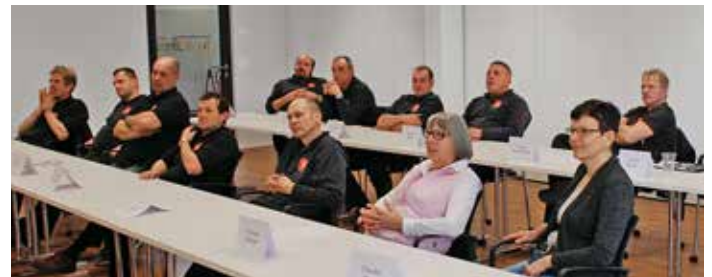
Le team de la protection anti-feu suit régulièrement des cours.

Dans ce 2ème volet nous vous présentons notre team dynamique de la protection anti-feu. Nos collaborateurs sont tous les jours en route en apportant une contribution précieuse d'augmenter la sécurité dans le domaine de la protection anti-feu dans toute la Suisse. Que ce soit à votre domicile, dans un établissement public ou dans une entreprise, notre team pour la protection anti-feu effectuée sur place un service sérieux pour les extincteurs. Les personnes sont formées en interne et suivent des formations en continue. Nous nous réjouissons spécialement de vous présenter ces collaborateurs.