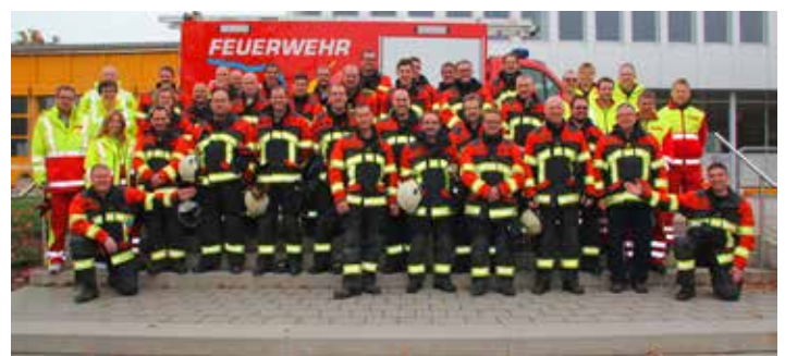
Sapeurs-pompiers de Büttikon-Uezwil – équipés de vêtements HUNTER RSK