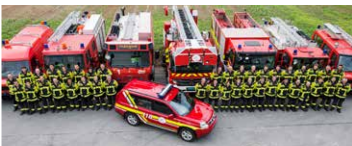
Sapeurs-pompiers régionales de Büren (Büren/Rüti/Arch/Leuzigen/Oberwil/Meienried) – équipés de vêtements HUNTER TITAN