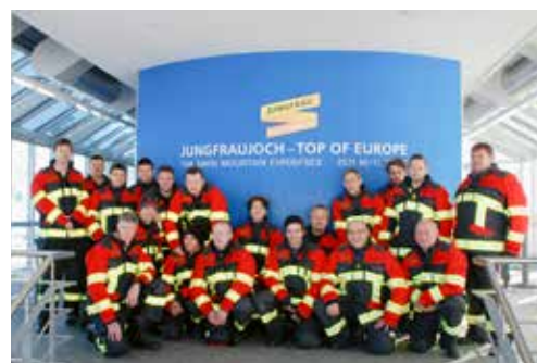
Photo imposante avec les pompiers du Jungfrauoch