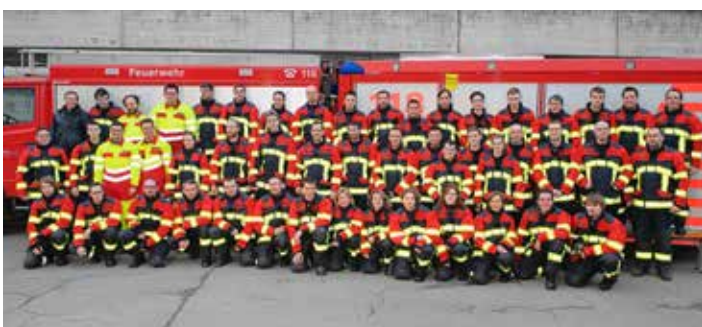
Sapeurs-pompiers de Villnachern – équipés de vêtements HUNTER RSK