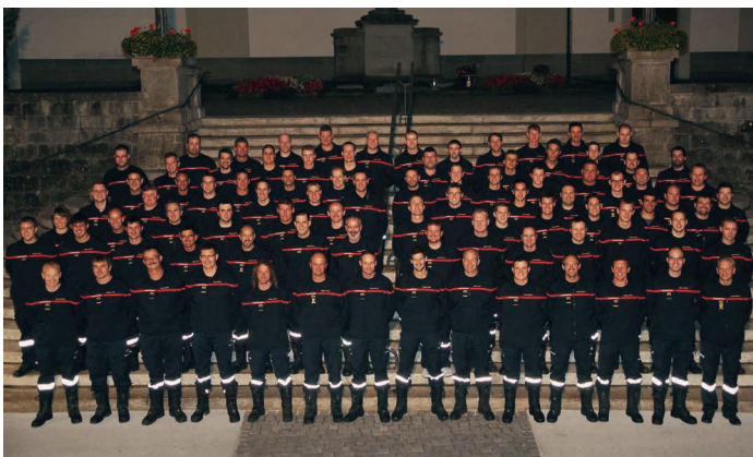
Sapeurs-pompiers de Willisau dans leur nouvelle tenue de sortie et de travail