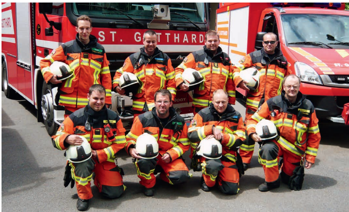
Sapeurs-pompiers d'intervention du Gothard en HUNTER/TITAN