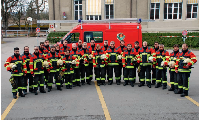
Sapeurs-pompiers de l'établissement Inselspital en HUNTER/RSK