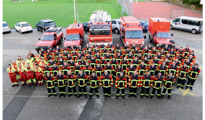
Sapeurs-pompiers de Michelsamt en HUNTER/RSK