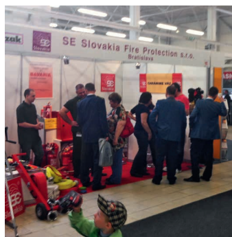
FIRECO TRENCIN (2 – 4 mai 2013)

Préavis: Prenez aussi note de notre participation à la foire Sécurité 2013 à Zurich (12 – 13 novembre 2013).