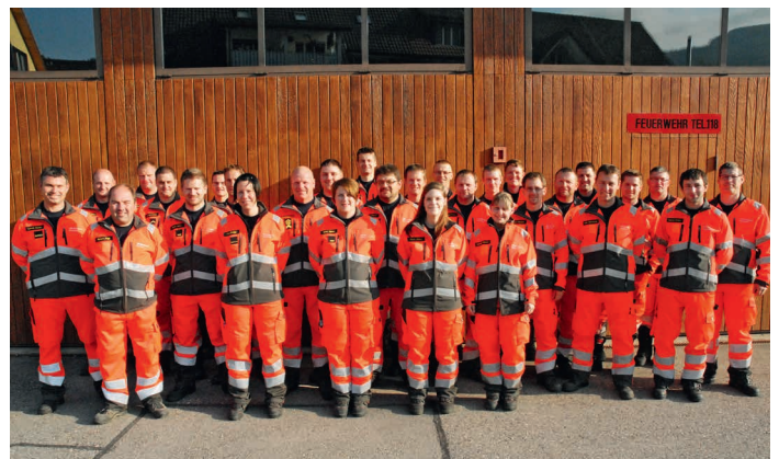
Sapeurs-pompiers de Mülliswil dans leur nouvelle tenue de travail