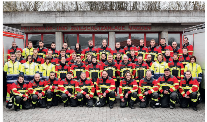
Sapeurs-pompiers de Magden-Olsberg en HUNTER/RSK