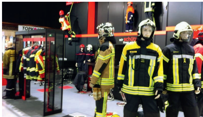
La Brandschutz Ettiswil se présentera ainsi à la Suisse Public.

Nous nous réjouissons dès aujourd'hui de vous surprendre par des sensations dans les spécialités vêtements de protection, appareils de sauvetage et protection contre les crues. Veuillez considérer qu'il n'est plus possible de distribuer des entrées gratuites. Nous vous remettrons avec plaisir le catalogue BE 2013 flambant neuf à notre stand. Réservez les dates de la Suisse Public – nous nous réjouissons de votre visite.