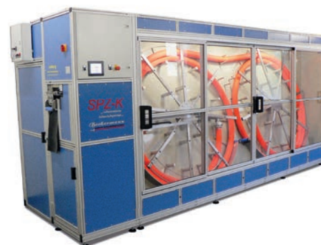
2 installations ont déjà été implantées en Suisse.

En tant que fabricant de tuyaux d'incendie et de tuyaux industriels, la Brandschutz Ettiswil s'intéresse à leur entretien. Une collaboration intéressante est née avec les producteurs de la société allemande Bockermann. L'installation compacte de maintenance de tuyaux SPZ-K a déjà été vendue deux fois en Suisse. Le service du feu de Frauenfeld et les sapeurs-pompiers professionnels de Berne possèdent déjà un tel système. Entièrement automatique, il peut être installé dans un espace minime et se commande par un écran. Les intéressés peuvent venir voir une installation en tout temps.