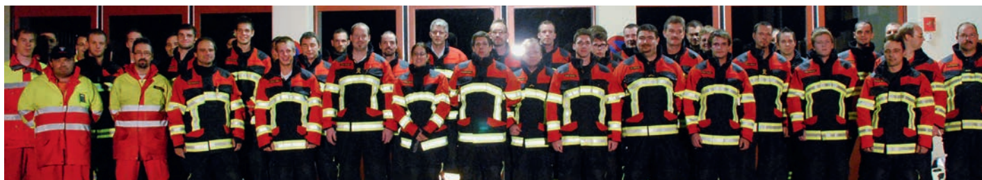
Sapeurs-pompiers de Wittnau AG – équipement HUNTER RSK