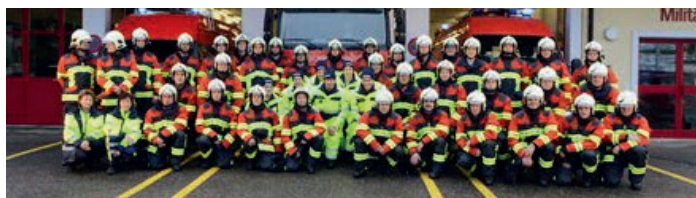
Sapeurs-pompiers de Herznach-Ueken AG – équipement HUNTER RSK