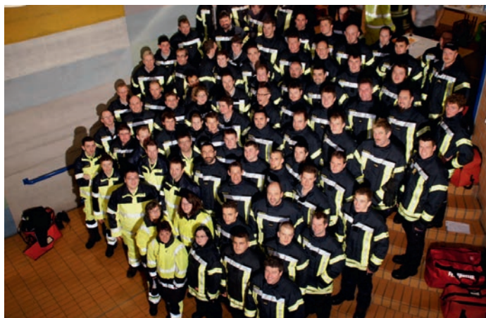
Sapeurs-pompiers de Wiggertal LU – équipement HERO