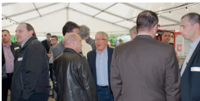
Discussions au lunch offert dans la maison Ettiswil