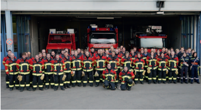
Sapeurs-pompiers AMG (Allmendingen–Muri–Gümligen) – équipement HUNTER TITAN