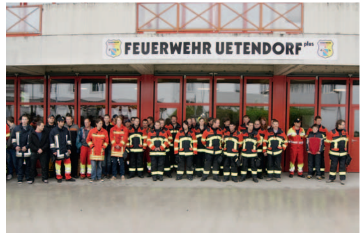
Sapeurs-pompiers d'Uetendorf plus – équipement HUNTER RSK