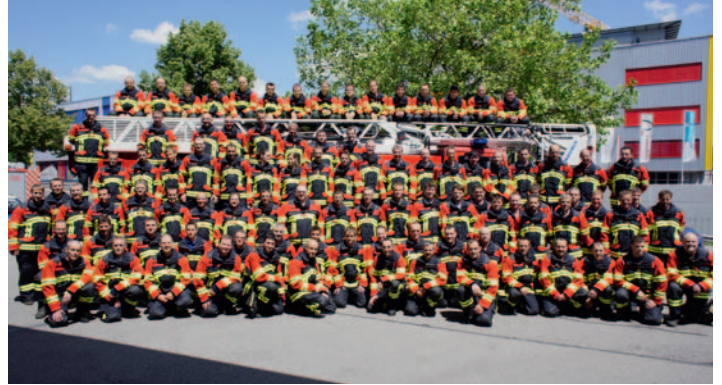
Sapeurs-pompiers de la région de Sursee – équipement HUNTER RSK