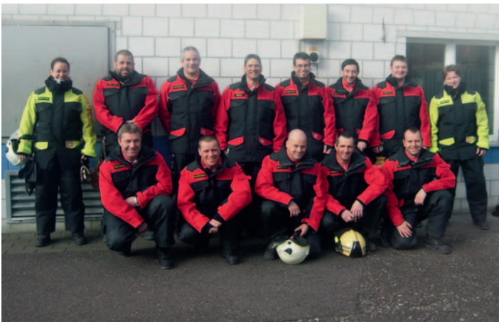
Centre de formation de Büren a/Aare – équipement HUNTER TITAN