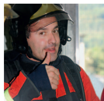
De g. à dr. Préparation à Büren a/Aare et à l'ifa, intervention à l'ifa, partout des visages satisfaits...