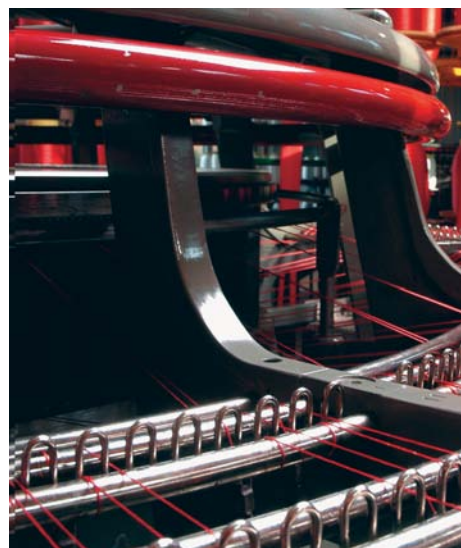
Brouillon: Agentur Frontal AG, Willisau