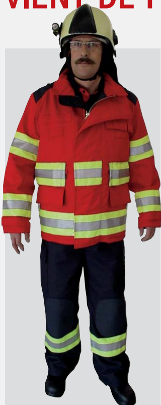
Les pantalons de protection-incendie Airlock-Königsline «Plus» sont livrables en bleu.