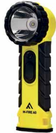
Art. 05.34052: CHF 65.– Preis ohne MwSt.

kann sie im Handumdrehen auf einen Gürtel oder an die Schutzkleidung montiert werden. In voller Ausrüstung sind kleine Schalter oder Drehknöpfe schwierig zu betätigen, daher wird die Winkeltaschenlampe mit einem leichten Druck an der Frontseite ein- und ausgeschaltet. Mit 4 AA-Batterien Power kann sie 13 Stunden Bestleistung erzielen. Sie strahlt das Licht aus mit einer Stärke von 270 lm und hat eine Reichweite von 250 Meter. Ein wichtiges Instrument für erfolgreiche Einsätze mit strahlender Weitsicht.