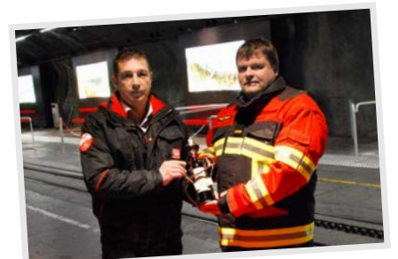
Die schönen Seiten im Aussendienst: Übergabe Brandschutzbekleidung Jungfraujoch.

kaufschulungen teil, wo sie Ihr Fachwissen immerzu vertiefen können und in ihrer Verantwortung sowie auch gemeinsam mit Brandschutz Ettiswil wachsen können. In diesem Sinne hoffen wir, dass Sie mit unserer Beratung zufrieden sind und bedanken uns an dieser Stelle für Ihre Kundentreue.