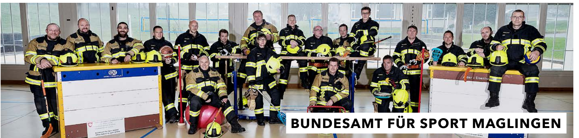
BUNDESAMT FÜR SPORT MAGLINGEN