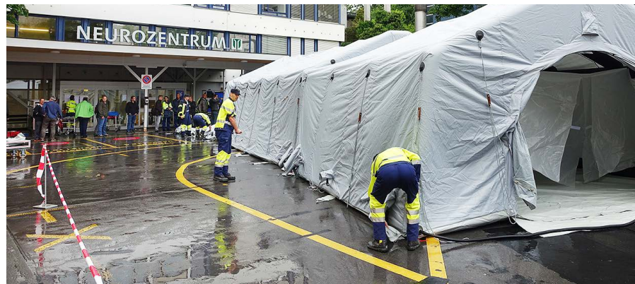
Die Dekontaminationsstelle wird unter realen Bedingungen aufgestellt