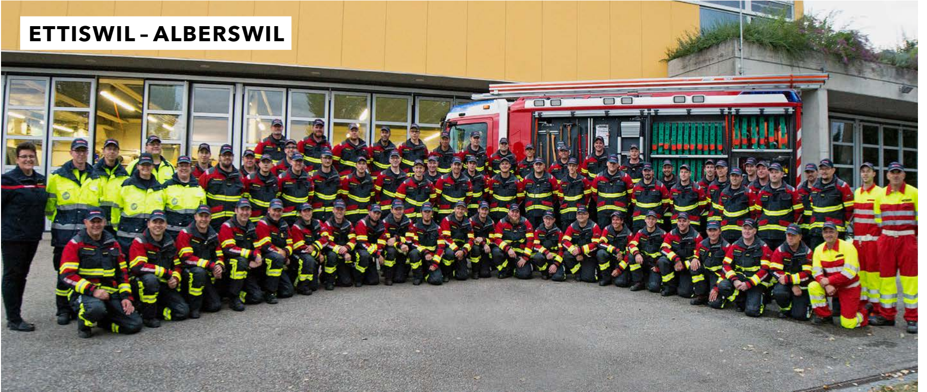
ETTISWIL - ALBERSWIL