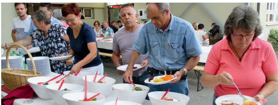
Das feine Buffet liess keine Wünsche offen

Am 26. Juni 2015 wurden die Mitarbeiter wieder zum alljährlichen Sommeranlass eingeladen. Auch die Partnerinnen und Partner nahmen am Anlass teil. Bei schönstem Wetter konnte man sich an einem grossen Buffet mit feinen Grilladen (serviert von Sternen Catering, Willisau) bedienen. Anschliessend wurde ein gemütliches Lotto mit interessanten Preisen gespielt.