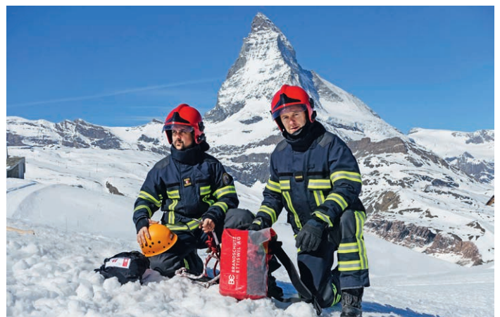
Ein Bild für die Ewigkeit! Auch die Feuerwehr Zermatt trägt unsere Brandschutzbekleidung (Modell Swissline mit Nomex Tough und Gore-Tex AIRLOCK)