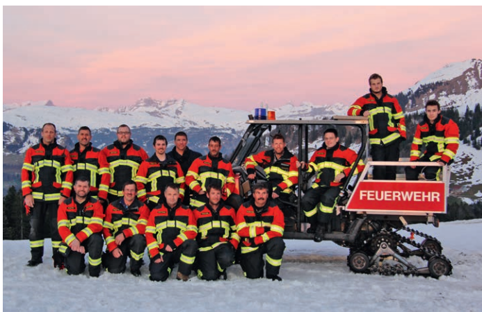
Feuerwehr Stoos – ausgerüstet mit Brandschutzbekleidung HUNTER RSK