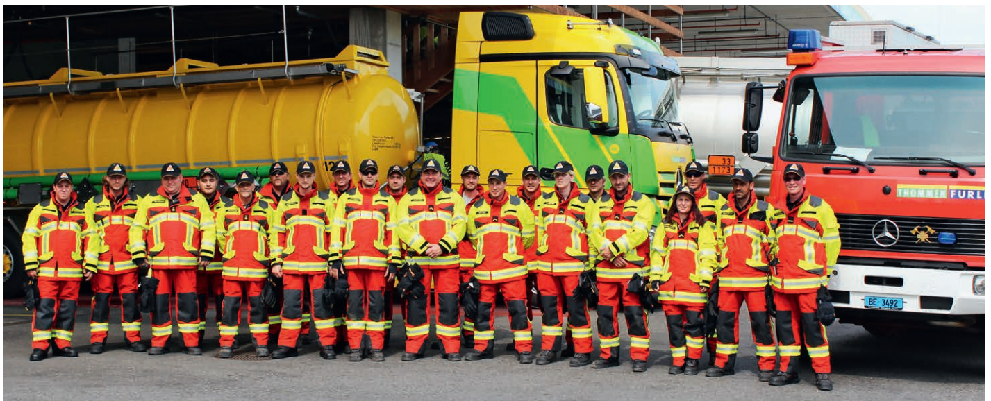
Betriebsfeuerwehr Thommen-Furler – ausgerüstet mit Brandschutzbekleidung HUNTER RSK