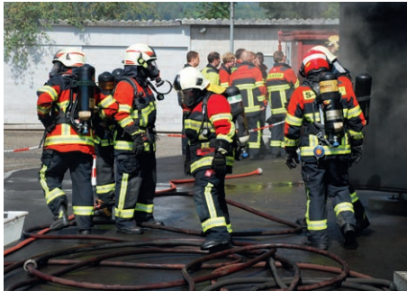
Den Teilnehmern wird im praktischen Teil alles abverlangt

Vorfeld werden den Teilnehmer interessante Referate geboten. Die Teilnehmer aus der ganzen Schweiz sind vor allem Beschaffer, welche sich ein Bild von der offerierten Bekleidung machen wollen. Die Brandschutz Ettiswil AG ist die einzige Firma in der Schweiz, welche diese Möglichkeit bietet!