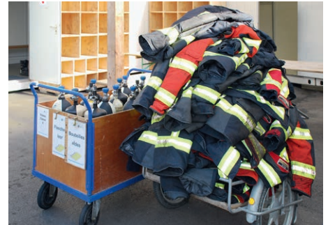
Die Brandschutz Ettiswil übernimmt auch die komplette Retablierung der eingesetzten Materialien