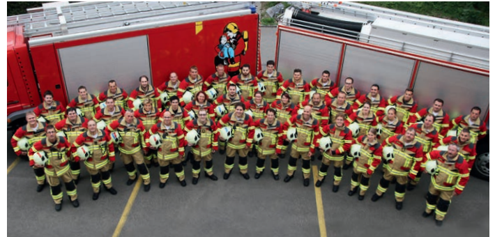
Feuerwehr Gränichen – ausgerüstet mit Brandschutzbekleidung HUNTER TITAN