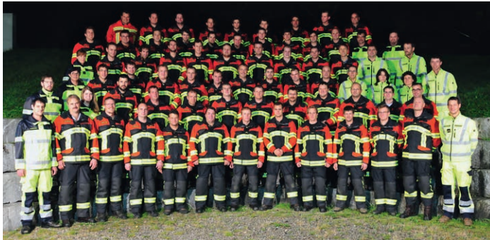
Feuerwehr Gansingen-Mettauertal – ausgerüstet mit Brandschutzbekleidung HUNTER RSK