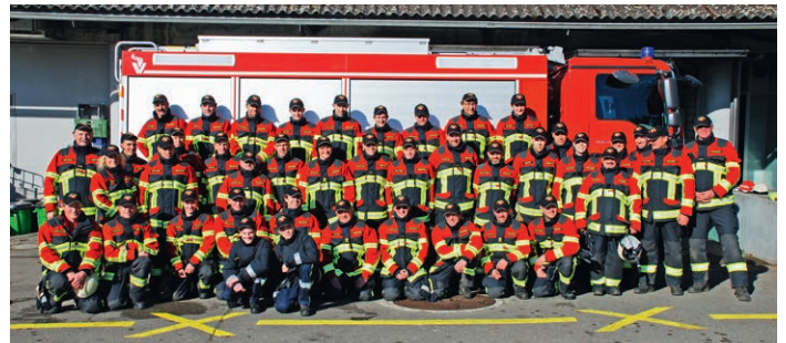
Feuerwehr Kirchlindach BE – neue Brandschutzbekleidung HUNTER TITAN