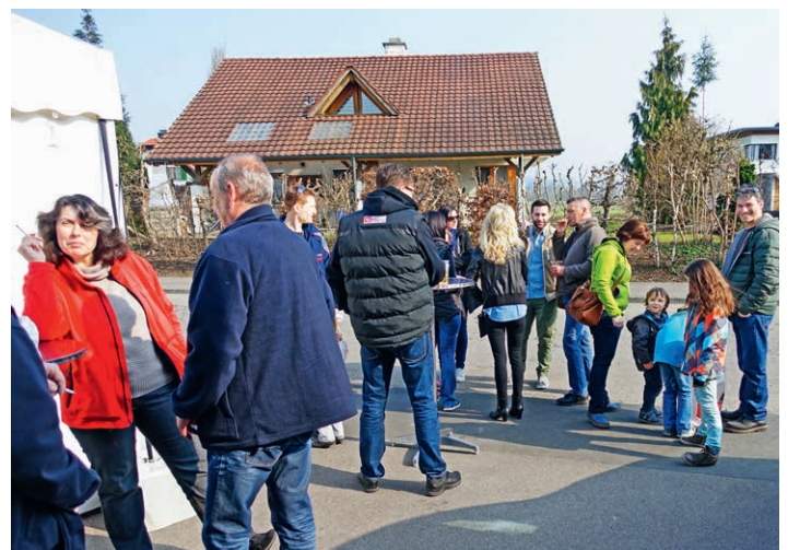
Angeregte Diskussionen der Besucher bei Sonnenschein