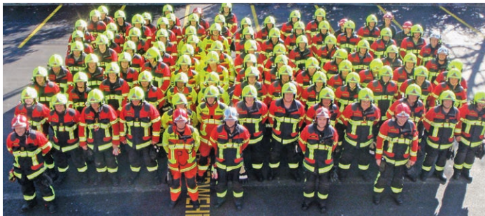
Feuerwehr Buchsi / Oenz BE – neue Brandschutzbekleidung HUNTER TITAN