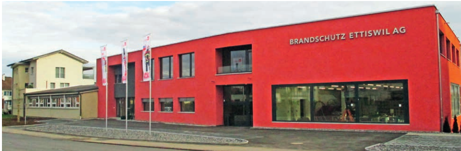
Oben: Vor dem Umbau im Februar 2014, unten: ein Jahr später im März 2015

Nach gut einem Jahr sind der Neubau des neuen Brandschutzzentrums und die Anpassungen im Stammgebäude fertiggestellt. Die 40-jährige Lagerhalle (Stahlbau) musste einem modernen Neubau weichen. Auch in den bestehenden Räumlichkeiten (in der alten Weberei) wurden tiefgreifende Änderungen vollzogen. Die gesamte Schlauchproduktion wird ins neue Betriebsgebäude verlagert. Die Innengummierung mit einer 50 m langen Gummierbahn wird neu im Untergeschoss mit einer hochmodernen Lüftung vollzogen. Mit einer Kompakt-Schlauchpflegeanlage «Bockermann» wollen wir den Schlauchservice ausbauen und unsere Kunden noch besser betreuen. Im Obergeschoss wird ein Theorieraum mit einem Fassungsvermögen von 2 x 40 Personen ausgebaut. Dazu können wir die Kunden in der Kantine mit einem feinen Essen direkt verpflegen. Dieser «komplette Umbau» wurde bis 31. Januar 2015 abgeschlossen. Die neuen Abläufe sind eingeschult und wurden einem breiten Publikum am 13. und 14. März präsentiert. Diese Weiterentwicklung des Unternehmens ist ein Meilenstein in der 62-jährigen Firmengeschichte!