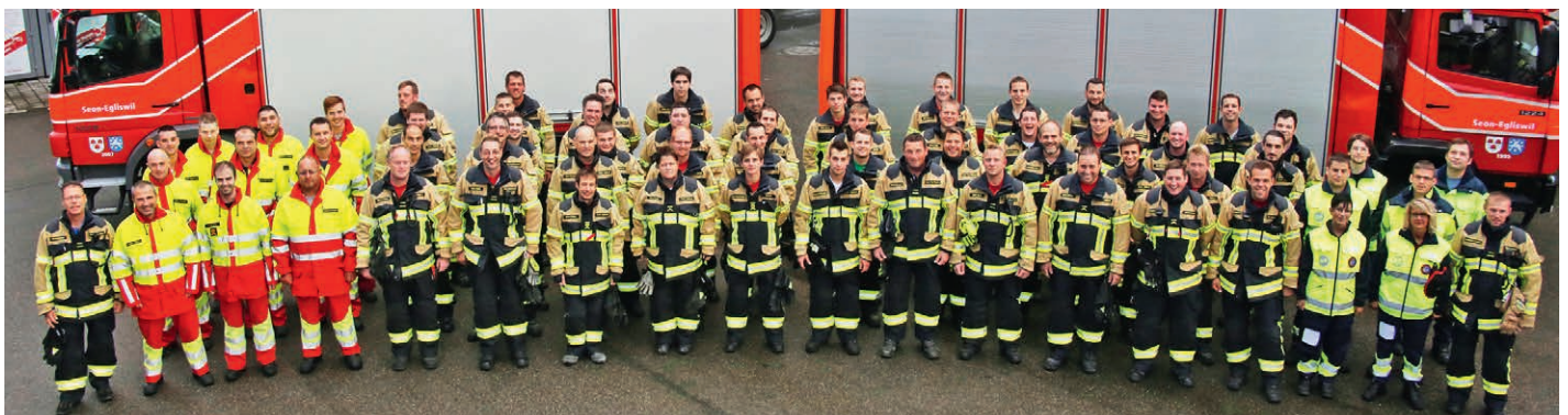
Feuerwehr Seon / Egliswil AG – neue Brandschutzbekleidung HUNTER TITAN