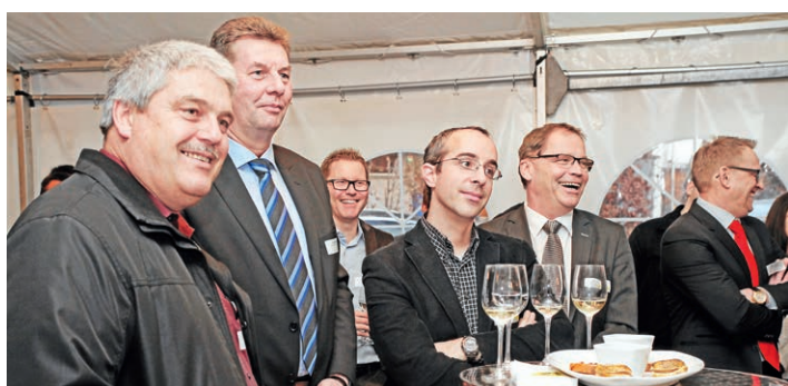
Gespannt verfolgen die geladenen Gäste die feierlichen Worte zur Eröffnung