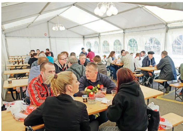
Die beliebte und von den BE-Ettiswil-Mitarbeitenden geführte Festwirtschaft