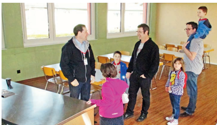
Eine Besuchergruppe in der neuen Kantine (Sammelplatz)