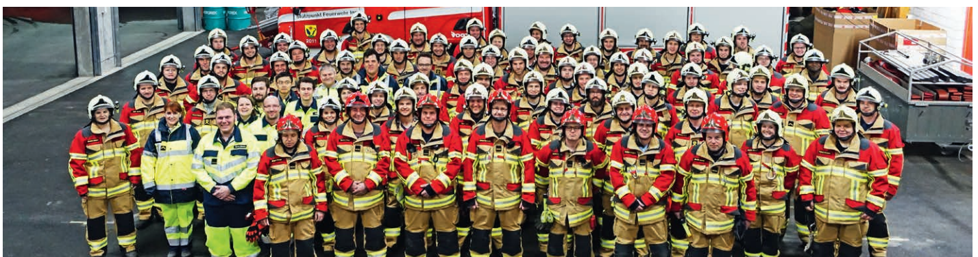
Feuerwehr Ins BE – neue Brandschutzbekleidung HUNTER TITAN

Wir danken den abgebildeten Feuerwehren für den Auftrag und hoffen, dass die neue Einsatzrüstung gute Dienste zur Erfüllung ihres Auftrages leisten wird!