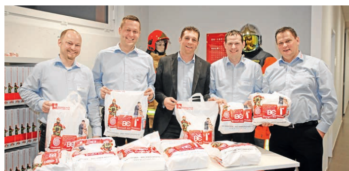
Das Team der Brandschutz Ettiswil AG überreichte den Gästen ein Präsent