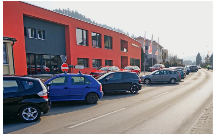
Die Hauptstrasse wurde zum Parkplatz umfunktioniert