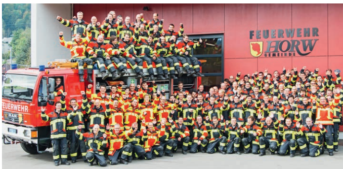
Feuerwehr Horw LU – neue Brandschutzbekleidung HUNTER RSK