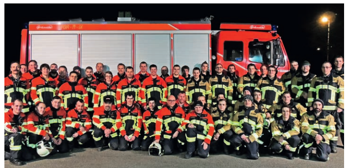
Feuerwehr Region Belchen BL – neue Brandschutzbekleidung HUNTER RSK