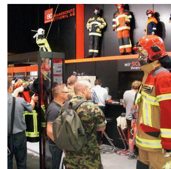
SUISSE PUBLIC BERN (18.–21. Juni 2013)