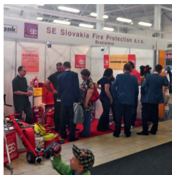
FIRECO TRENCIN (2.–4. Mai 2013)

Voranzeige: Beachten Sie auch unsere Teilnahme an der Messe Sicherheit 2013 in Zürich (12.–15. November 2013)