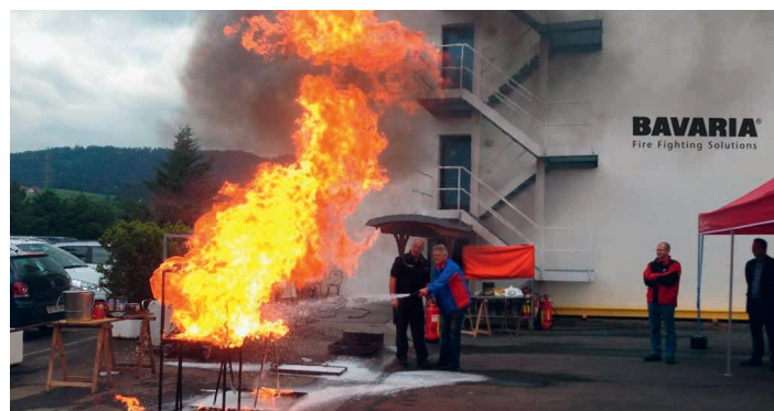
Das nächste Fachsymposium findet am 31. Oktober 2013 statt.