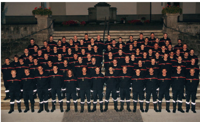
Feuerwehr Willisau mit neuer Ausgangs- bzw. Arbeitsbekleidung