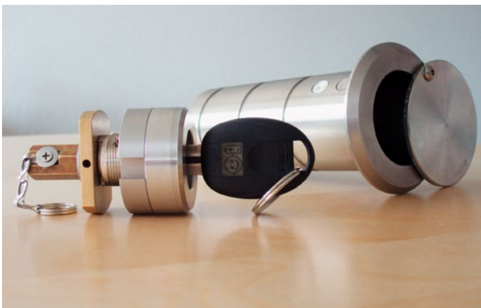
Zum Einführungspreis ab SFr. 950.00