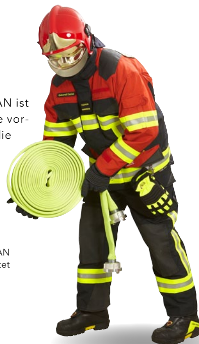
Bereits wurde die FW Köniz mit TITAN ausgerüstet

erfolgreich bestanden. TITAN ist in einer grossen Farbpalette vorhanden. Komplettiert wird die Einsatzbekleidung Nomex® (Hainsworth® TITAN) von einer Hochleistungsmembran in Gore-Tex® Airlock-Spacer Technology.