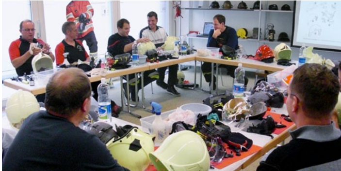
Die Gallet Helm-Infotage erfreuen sich an reger Beteiligung

Unter der Informations-Plattform « Feuerwehr Campus Schweiz » führen wir wieder die bewährten Gallet Helm Informationstage durch. Wir möchten Sie als führender Anbieter von