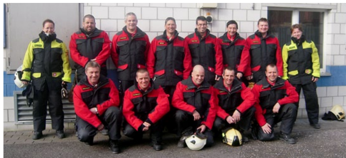
Auch die Instrukoren in Büren an der Aare vertrauen TITAN

Die Einsatzbekleidung Nomex® (Hainsworth® TITAN) bietet im Fall eines Flashovers eine sehr hohe Wärmeisolierung. Sobald eine grosse Hitze oder Flammen auf die Lage aus Nomex® und das Gitter aus Kevlar® einwirken, ziehen sich diese in leicht unterschiedlichem Mass zusammen, so dass sich zwischen den Lagen Lufttaschen bilden. Dieser aktive Lufteinschluss erhöht die Hitzeisolierung des doppellagigen Gewebes, weshalb nach Auskunft von Hainsworth bis zu «25% bessere Werte» als bei anderen Geweben mit ähnlichen Flächengewicht erreicht werden können. Das S-Gard Anzugssystem TITAN hat auf dem DUPont Thermo-Man den Acht-Sekunden-Beflammungstest