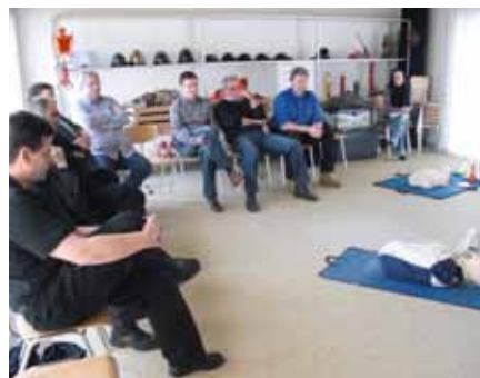
Die Mitarbeiter der Brandschutz Ettiswil AG während der Schulung.

Jedes Jahr findet in der Brandschutz Ettiswil AG eine Mitarbeiterschulung statt. Die Schulung fand Ende Januar statt, ganz im Zeichen der Lebensrettenden Sofortmassnahmen. Durchgeführt wurde die Schulung durch die Firma ES Sicherheit AG, Sicherheitsschulungen, St. Gallen. Zwei kompetente Instruktoren haben allen Anwesenden das «ABCD» der Nothilfe beigebracht. Highlight war schlussendlich noch die Schulung am Defibrillator. Ab sofort steht am Schalder unserer Firma ein solches Gerät für den Notfall zur Verfügung.