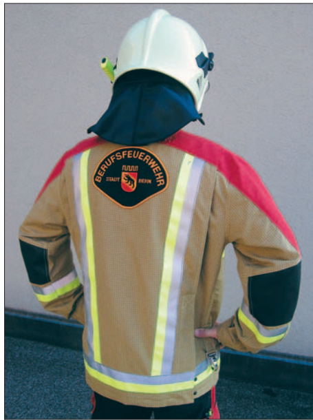
Auch der Rücken bietet eine gute Sichtbarkeit.