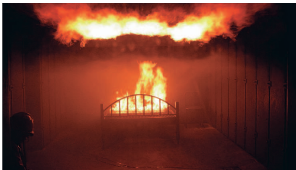
Tolle Impressionen von der Ausbildung.