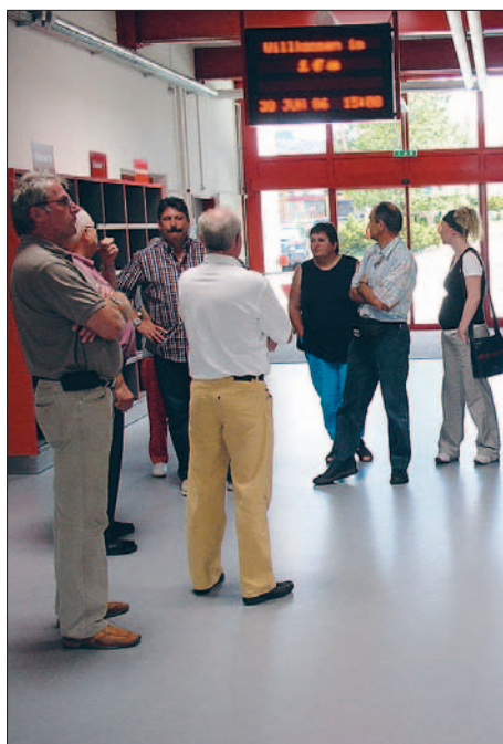
Die 22 Mitarbeiter wurden in Gruppen aufgeteilt.