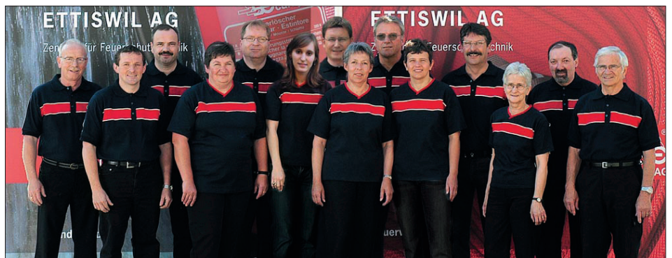
Das SE-Feuerwehr-Team bedankt sich für die gute Zusammenarbeit.