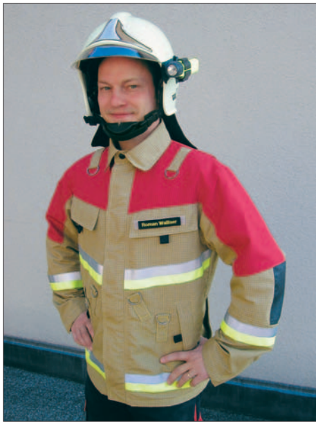
Die leichte Pionier-Jacke passt gut zur Brandschutzbekleidung.

ist mittelweit geschnitten und bietet u. a. die Möglichkeit, die Funkgerätes tasche wie an der Original-Brandschutzjacke anzubringen. Das Aussenmaterial umfasst Nomex Delta TA und ist verstärkt mit Gitter aus 100% Kevlar (Rip-stop). Wir wünschen der BF Bern weiterhin viel Erfolg bei den Einsätzen und bedanken uns für die gute Zusammenarbeit!