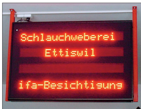
Gebührender Empfang im «ifa».