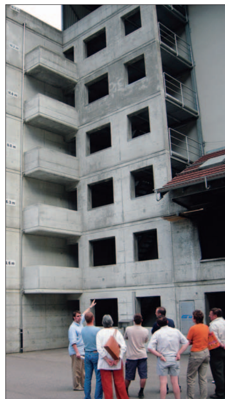
Niklaus Vonder Mühl erklärt das Trainingsgelände aussen.