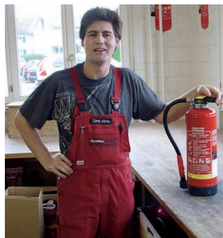
Konzept: Agentur Frontal AG, Willisau

Wir wünschen ihm viel Erfolg in seinem Einsatzgebiet!