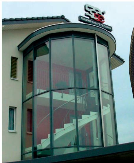
Die beiden «Markenzeichen» der Schlauchweberei Ettiswil AG.